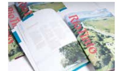
DÉPLIANTS ET BROCHURES