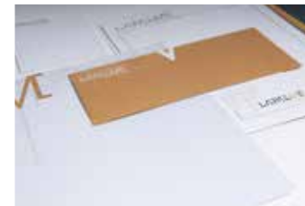
POCHETTES ET PAPETERIE